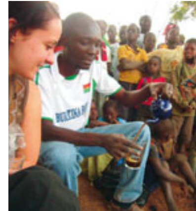
Au Burkina Faso, des jeunes suisses ont aidé à organiser des activités comme des «thé-débats».

ment s'exprime-t-elle dans mon pays?», «Comment faire pour améliorer la participation des jeunes en Suisse, au Burkina, en Haïti?», sont autant de questions que se sont posés les participants. Ils ont eu à formuler une réponse concrète en montant deux projets de sensibilisation à destination de jeunes du Burkina Faso. De retour chez eux, les formateurs sont en train de tirer des leçons de ces échanges pour encore mieux accompagner les jeunes.