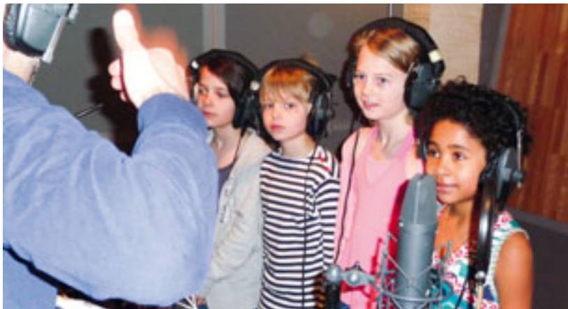
42 écoles en Suisse romande se sont inscrites pour participer à l'action «Une chanson pour l'éducation».

Afin de promouvoir des actions d'éducation et de santé de qualité, Enfants du Monde participe dans différents réseaux actifs en Suisse.