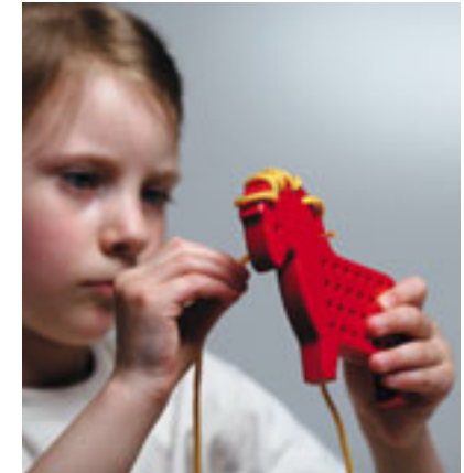
Des jouets solidaires: 10% du revenu de chaque article bébé vendu en ligne sont reversés à Enfants du Monde.