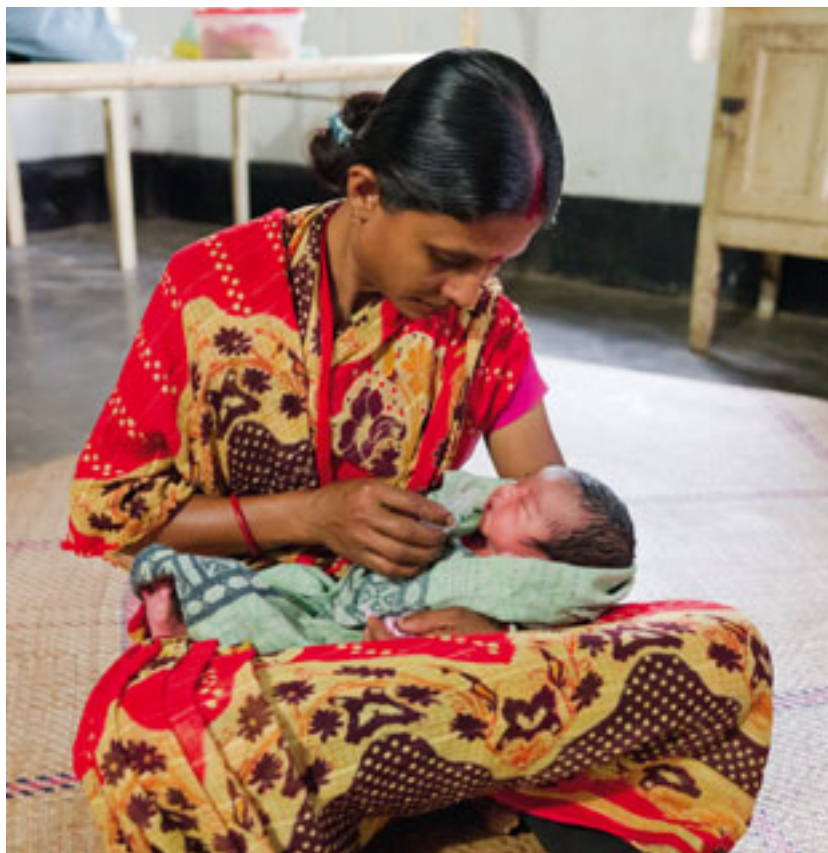
Le programme de santé d'Enfants du Monde a permis de réduire le nombre de décès de mères et de bébés.

Au Nord du Bangladesh, les centres médicaux sont quasiment inaccessibles aux habitants des villages éloignés. L'état des routes est mauvais et les moyens de transport font souvent défaut. Avec le soutien d'Enfants du Monde, ces villages se mobilisent pour aider leurs femmes et leurs bébés à accéder à des soins de santé.