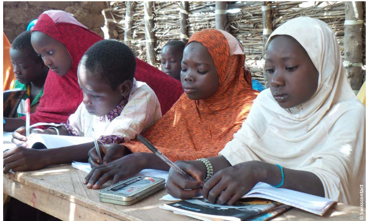
Schülerinnen und Schüler in einer Schule des CCEAJ in Dolé, Niger