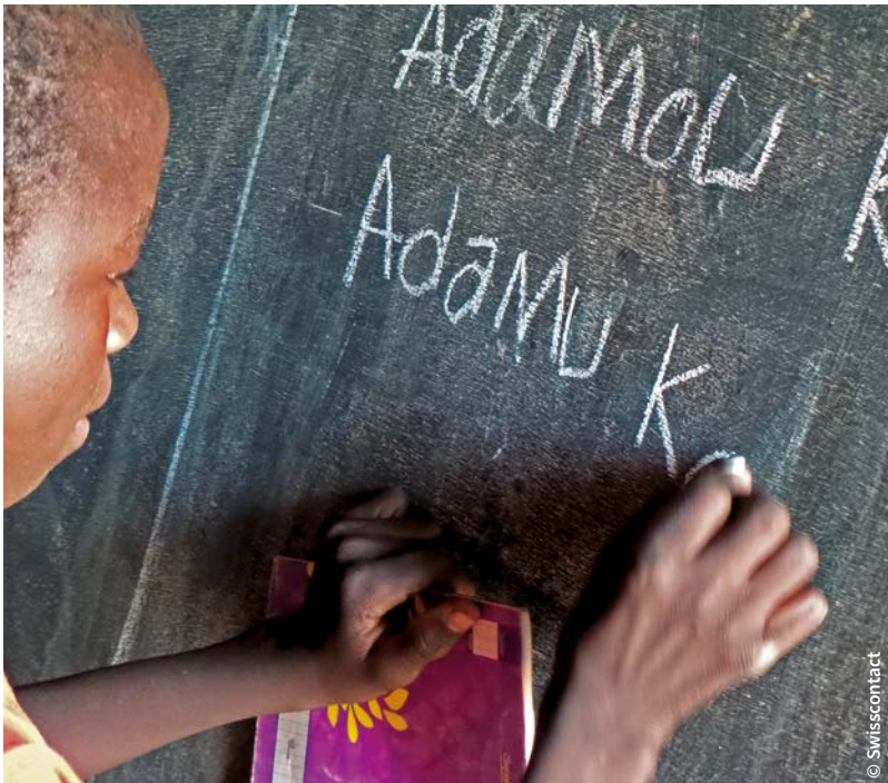
Schüler in einer Schule des CCEAJ in Bengou, Niger