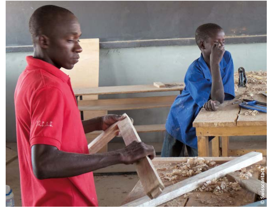
Schülerinnen und Schüler, die in einer Schule des CCEAJ einen handwerklichen Beruf erlernen

Die Zufriedenheit in den Gemeinden sowie der Schülerinnen und Schüler ist deutlich spürbar. Der zuständige Direktor des Instituts zur Förderung von Alphabetisierung und nicht formaler Bildung sowie das Bildungsministerium planen die Umsetzung des Programms auf nationaler Ebene – die ist ein klares Zeichen für seinen Erfolg!