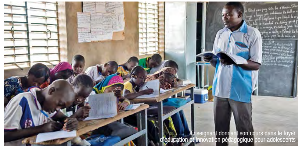
Enseignant donnant son cours dans le foyer d'éducation et innovation pédagogique pour adolescents

En tant que formateur dans les écoles, ce Master va influencer positivement mes stratégies de formation, mes lectures et mes orientations de sorte à contribuer à la qualité de l'éducation par le développement de nouveaux matériels pédagogiques.