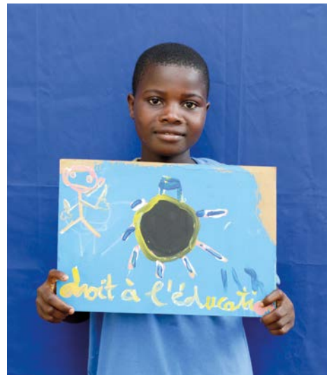
Élève à Abomey Calavi au Bénin.

Ils réalisent ensuite une photo d'un droit qui leur tient à cœur. Ces réalisations seront cette année aussi partagées avec des enfants d'autres pays dans lesquels Enfants du Monde intervient, grâce à un Globe Virtuel à découvrir sur www.edm.ch/globe-virtuel .