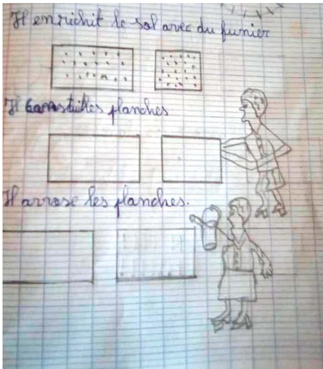
Le cahier de métiers sur le maraîchage.

Enfin, comme tous les cours sont dispensés en français et en langue maternelle, des formations sont organisées en faveur des enseignants pour leur permettre de bien gérer un enseignement bilingue.