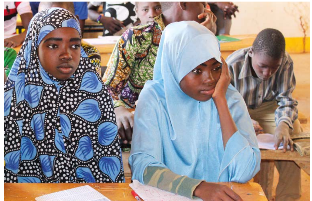
Élèves d'un Centre Communautaire d'Éducation Alternative au Niger.

de cet entretien des textes ont été rédigés pour des activités de lecture, des exercices mathématiques (problèmes de la quantité de métal à utiliser, du nombre d'outils nécessaires, etc.) ou encore les sciences sociales et naturelles. De retour à la maison, les enfants peuvent utiliser leurs connaissances pour aider leurs parents , faire des calculs au marché, etc.