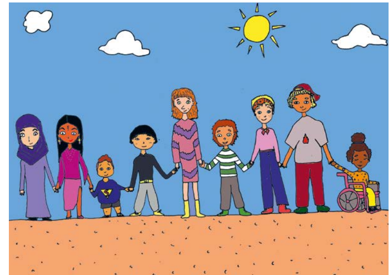
Le droit d'être différent illustré par Aylin Prisi Gonzalez, stagiaire de l'HETS