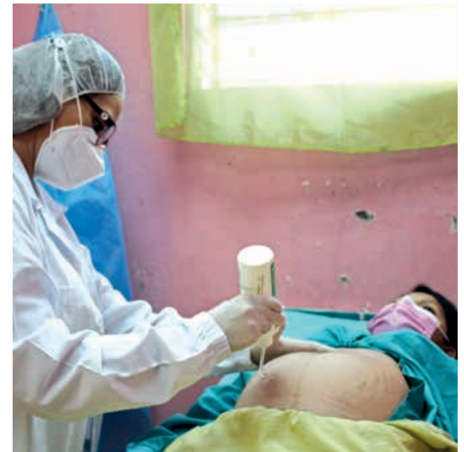
Consultations pour des femmes enceintes et des jeunes mamans dans un centre de santé au Salvador.

Enfin, une application gratuite « Mon bébé et moi » pour les téléphones mobiles a été créée afin d'informer les femmes enceintes et jeunes mamans sur la grossesse, l'accouchement, la période postnatale et la COVID-19.