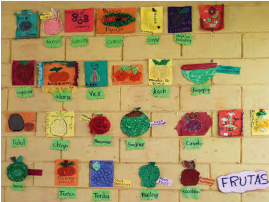
Les élèves apprennent à nommer en cakchiquel, espagnol et depuis peu en anglais les fruits qu'ils mangent tout au long de l'année.