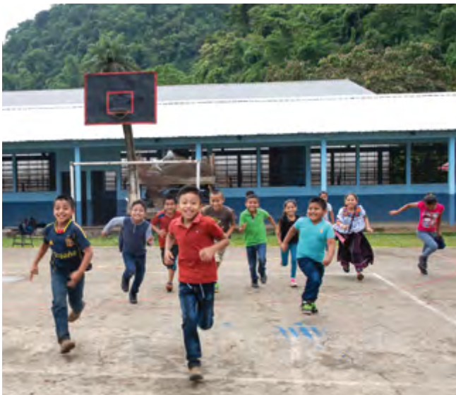
Ces élèves de 3 ème primaire à Tecpán bénéficient d'une éducation plurilingue et interculturelle.