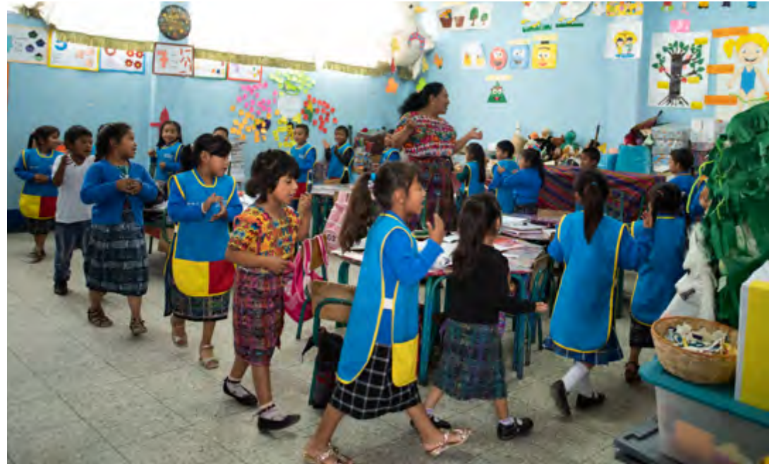
Le changement pédagogique se remarque aussi dans l'utilisation de l'espace : les pupitres sont disposés de façon à pouvoir circuler autour.