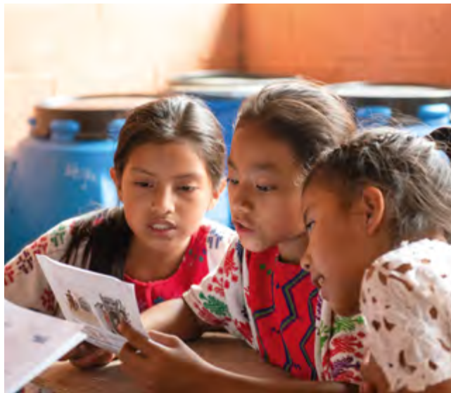
L'apprentissage de textes en groupe stimule la réflexion et l'argumentation.

pose encore Aby Jutzuy. Les sujets traités sont également concrets : écrire une lettre d'invitation, tenir les comptes des produits vendus au marché, découvrir les contes oraux de la communauté, etc. La dernière thématique abordée portait sur la préservation de l'environnement, à travers le recyclage et la gestion des déchets.