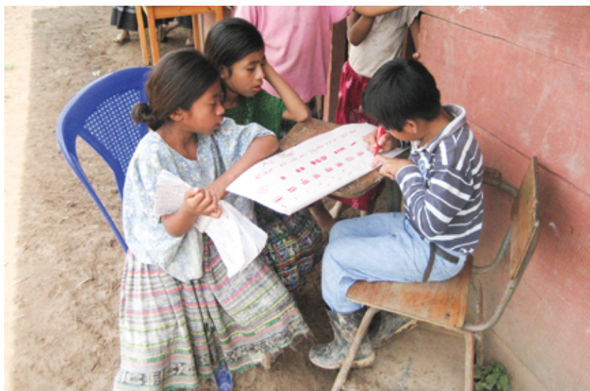
Au Guatemala, le programme d'éducation touche aujourd'hui plus de 300 écoles publiques. Les enfants mayas bénéficient d'un enseignement bilingue et adapté à leur culture – ils apprennent par exemple les mathématiques mayas.

tion nutritionnelle des enfants, les conditions de vie d'enfants de la rue et la santé des mères. Enfants du Monde appuyait surtout financièrement des projets exécutés par des organisations locales.