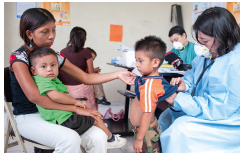
Au Salvador, Enfants du Monde a commencé son travail dans deux municipalités. Aujourd'hui, plus de 60'000 femmes enceintes, mères et bébés en bénéficient.

Au Guatemala, le défi majeur est de diminuer le taux d'analphabétisme très élevé. Dans certaines régions du pays, plus de 80% de la population indigène d'origine maya ne sait ni lire ni écrire. Les établissements scolaires font défaut et même quand ils existent, les parents refusent d'envoyer leurs