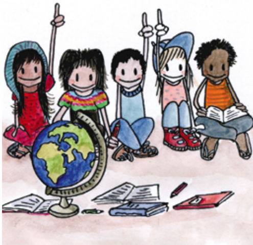
Le projet «Un Monde plus juste» amène les enfants à réfléchir sur leurs droits et à s'engager.

Dans un deuxième temps, chaque enfant a choisi un des droits de la Convention des droits de l'enfant et l'a illustré avec une photo en se