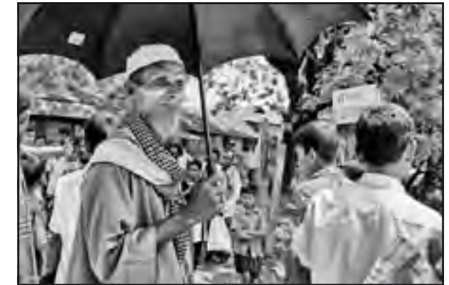
Bangladesh, 2011: dans un village.