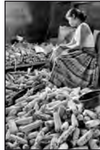
Guatemala, 2010: village maya.