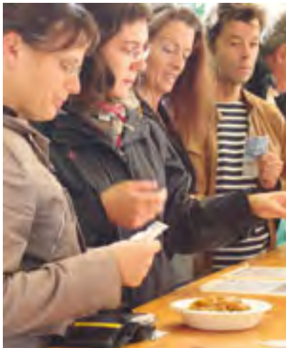
Les visiteurs font la queue.