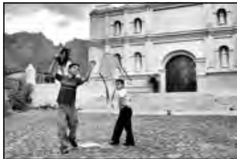
Salvador, 2009: région rurale.

J'ai une prédilection pour les thèmes liés aux conditions de vie particulièrement différentes de notre vision occidentale. J'aime aborder des thèmes précis, par exemple les communautés rurales au Bangladesh, en montrant la réalité avec un point de vue personnel. J'essaie d'attirer l'attention du spectateur sur un sujet et son contexte de façon à le pousser à voir au-delà du cadre de la photo. Je décrirais donc mes images comme un prétexte pour une réflexion sur un thème.