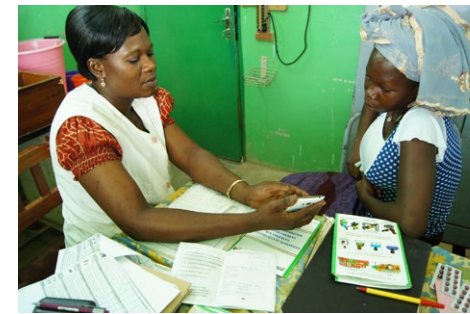
Vorgeburtliche Untersuchung in Burkina Faso mit der Broschüre zur Geburtsvorbereitung und der PANDA-App von Enfants du Monde.

Wir entwickeln pädagogisches Material für Jugendliche und schulen Betreuungspersonal und Lehrkräfte für die Durchführung partizipativer Aktivi-