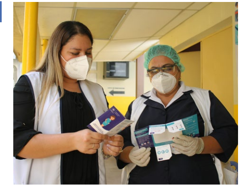
Pflegekräfte mit den Broschüren von Enfants du Monde in einem Gesundheitszentrum in El Salvador.

In Zusammenarbeit mit der Weltgesundheitsorganisation (WHO), dem lateinamerikanischen Zentrum für Perinatalogie (CLAP) und der panamerikanischen