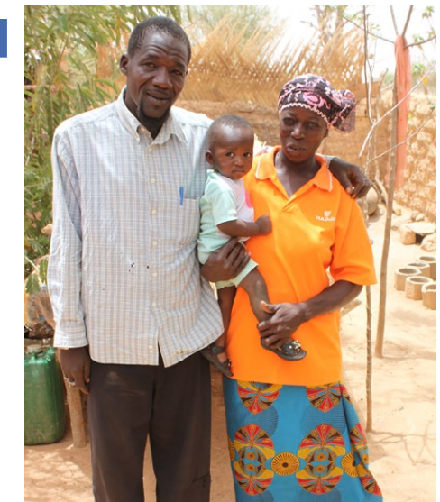
Ein Paar nach einer Informationsveranstaltung zum Thema Gesundheit in Burkina Faso.